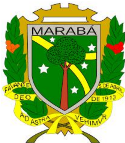
Brasão de Marabá