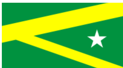
Bandeira de Marabá