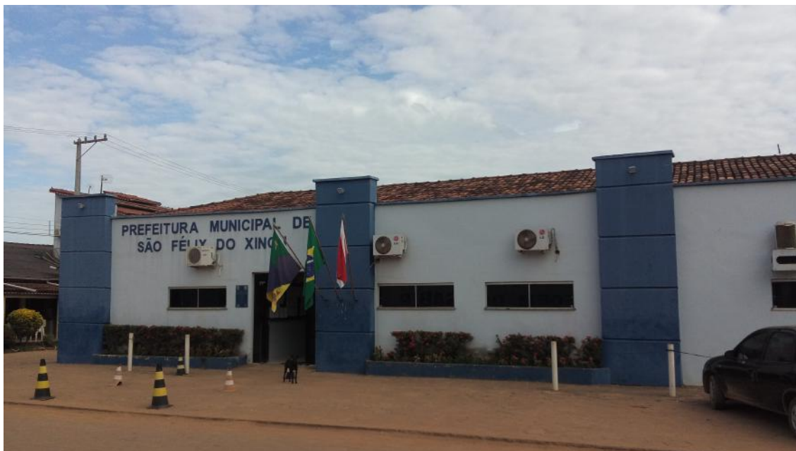
Figura 1: Prefeitura de São Félix do Xingu, 2016 Fonte: Acervo CEPI/DPOT/SETUR