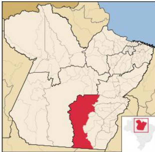
Imagem: Google, 2016