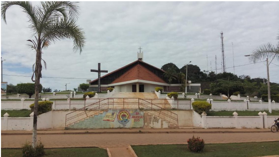
Figura 7: Igreja das Mercês, 2016