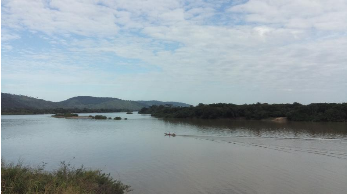
Figura 6: Rio Fresco, 2016