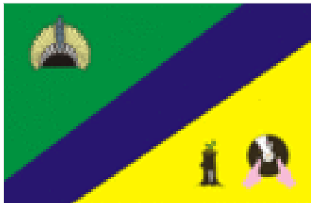
Bandeira de São Félix do Xingu