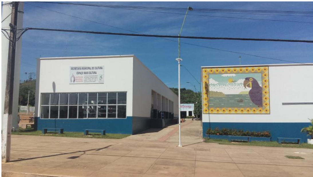
Figura 4: Céu, 2016