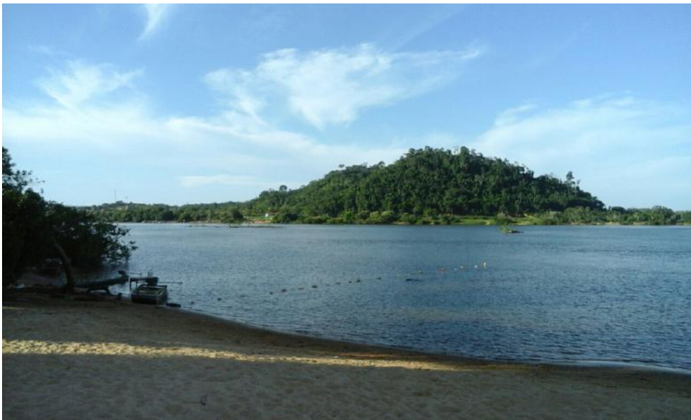
Figura 5: Praia do Porco, 2016