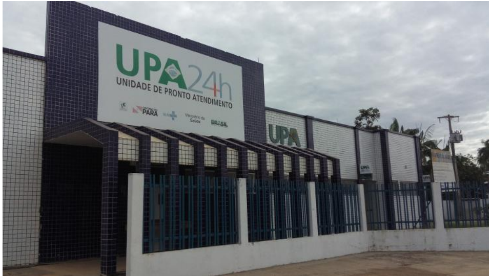
Figura 2: UPA São Félix do Xingu, 2016