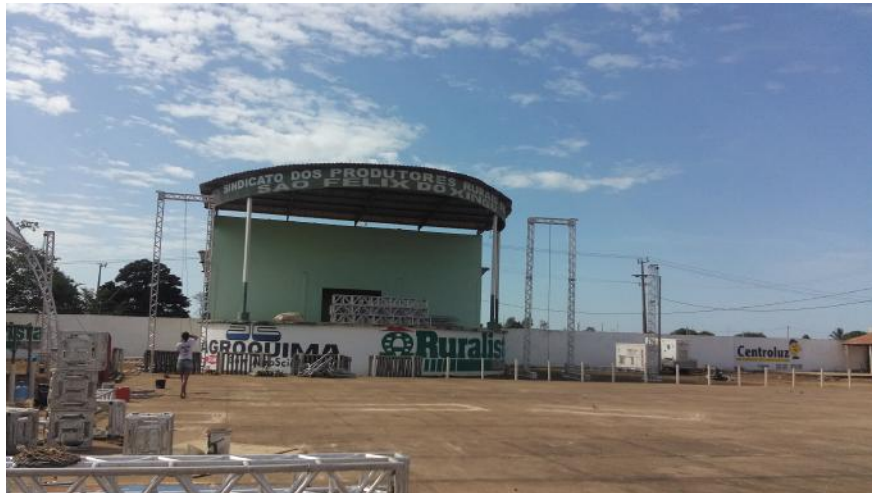
Figura 3: Palco do Parque de Exposições, 2016